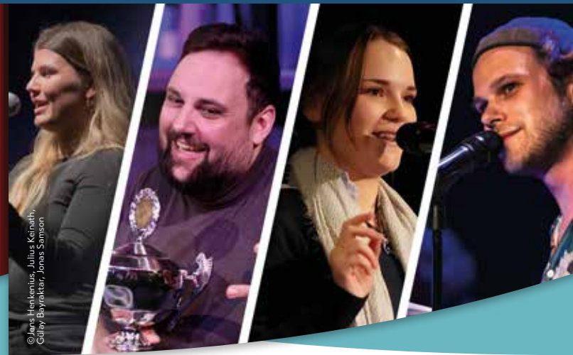
© Jans Heckenius, Julius Keirath, Gulay Bayraktar, Jonas Süssner